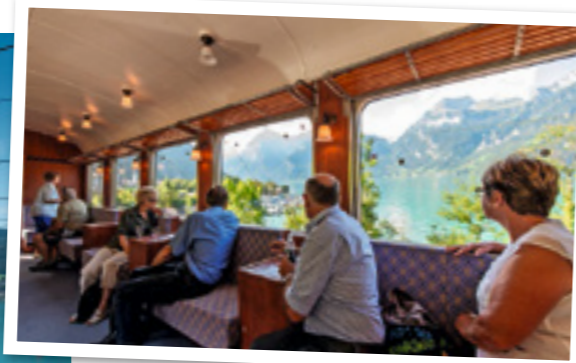
Fenster zum See: Im Salonwagen des Swiss Classic Train.