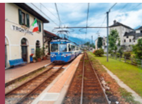
Schmalspur: Mit dem Bähnli durchs Centovalli. Locarno: Die Kirche Madonna del Sasso (r.)

Gleiches Programm nur in umgekehrter Reihenfolge. 1.Tag: Fahrt im Sonderzug über den Gotthard nach Locarno 2.Tag: Rundgang und fakultativer Ausflug Verzascatal 3.Tag: Freier Tag oder fakultativer Ausflug Maggiatal 4.Tag: Fahrt durch das Centovalli und im Blauen Pfeil nach Bern